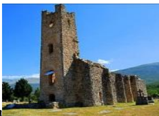
Crkva sv. Spasa

Ustajanje cca 06,00 - doručak do 07.15, u 7,30 sa svim stvarima polazak prema izvoru rijeke Cetine, posjeti crkvi sv. Spasa , koja je jedan od najbolje očuvanih spomenika ranosrednjovjekovnog sakralnog graditeljstva u Hrvatskoj i jedina crkva iz 9. st. čiji toranj na zapadnom portalu (vestverk - predbrod) još uvijek stoji. Ova starohrvatska crkva je izgrađena u zadnjoj četvrtini 9. st. za vrijeme vladavine Branimira, hrvatskog kneza Primorske Hrvatske. Crkvu je podigao "cetinski župan Gastika (Gostiha)" u sjećanje na svoju majku i svoje sinove kako je zabilježeno na pronađenim ulomcima oltarne ograde.